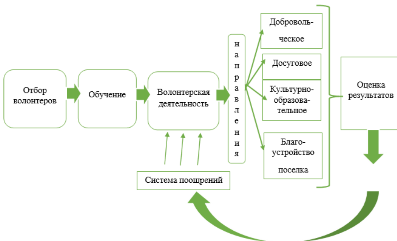
Рис. 1. Механизм реализации волонтерской деятельности в БУ «Березовский районный комплексный центр социального обслуживания населения»

жилого возраста, инвалидам, детям из семей, находящихся в социально опасном положении.