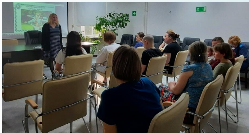
Диспут с родителями