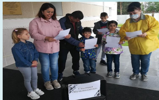
Квест-игра: «В поисках семейных ценностей»