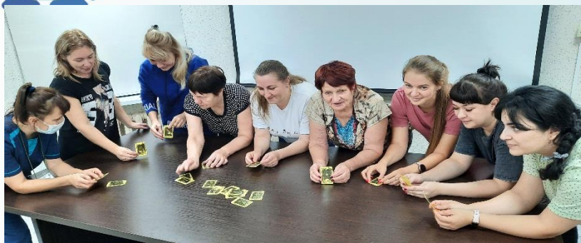
Обсуждение проблемных вопросов